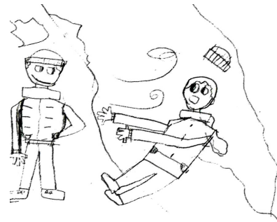
Рис. Арины Шелег